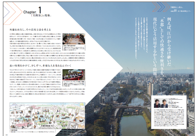
2020入試大学案内特集ページ