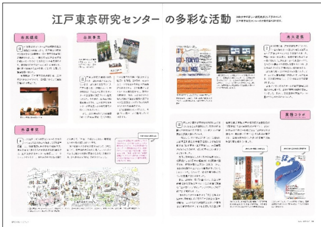
広報誌 HOSEI 特集記事の一部

受験生向けの広報として入学センターが作成する「2020年度大学案内」の特集ページ「実践知の現場」において外濠市民塾の活動が掲載された。