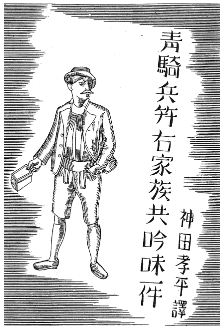
神田孝平訳「青騎兵并右家族共吟味一件」のさし絵（『新青年』所収，昭和6・4）。

rechtsgeeding van zonderlingen zamenhang, door de eindelijke ontdekking van eene zware misdad, opgelost. といひ、長ったらしいタイトルが付いている。この文は――