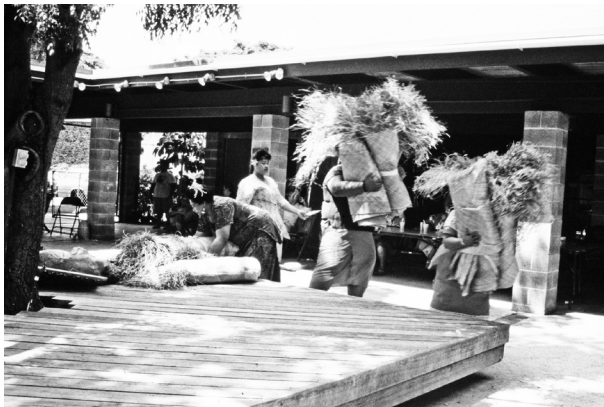
写真3 移民社会で10枚1束のファイン・マットを贈る (ホノルルにて)

理論的には移民コミュニティではファイン・マットが不足しているはずであったが、ファイン・マットは消費されないため、次第に蓄積されていき、移民コミュニティの儀礼交換に登場するファイン・マットの数は本国社会のそれを凌駕するようになった。80年代後半にハワイを訪れたときに