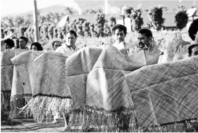
写真2 儀礼交換でファイン・マットを贈る（サモアにて）

多くの場合、食糧はもってきた人が生活の中で消費してしまう。それに対して、ファイン・マットは実は贈与品として渡される以外の用途はほとんどない。高位首長やその娘・息子など身分の高い人が儀礼や公的ダンスの晴れの舞台において、ファイン・マットをまとうことはないわけではないが、ごく限られた場面であり、ほとんどのファイン・マットは、入手すると首長やその妻などのベッドの下に隠しておいたり、長持ちの中に入れておいたりしてとっておいて、贈与すべき次の場面で贈与に供されることになる。人々の手から手へと贈与されていくのが、ファイン・マットの主たる価値であり、その点でファイン・マットは貨幣に近いといえないこともない。文化人類学の用語で呼ぶならば、原始貨幣、あるいは、交換財、威信財ということになる。