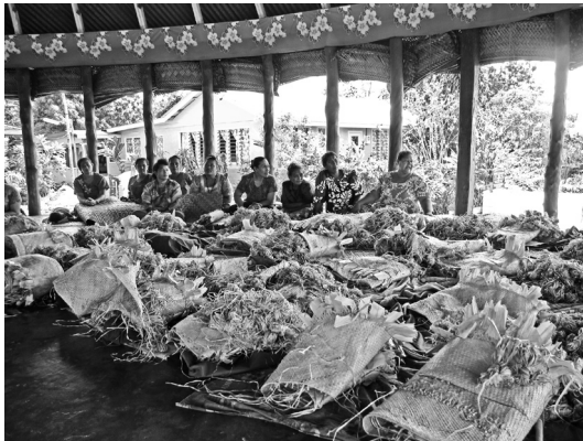
写真4 ファレ・ララガでの視察風景（サモア・サヴァイイ島にて）

筆者は2011年の現地調査に際して、女性局の担当者の視察に同行させてもらった。ファレ・ララガは伝統的な活動のひとつで、一週間に一度（たいてい水曜日から木曜日）集まっておしゃべりをしたり、歌ったり、食事を