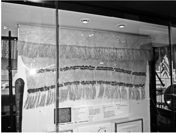
写真1 アンティークのファイン・マット（オークランド博物館所蔵）

に編んでいくのを常としている。ファイン・マットは、小さいもので畳より少々大きい位の大きさで、長辺の一方を編みはなして繊維を房状に垂らし、その上に本来であれば、赤いオウムの羽を飾ってつける 4) 。