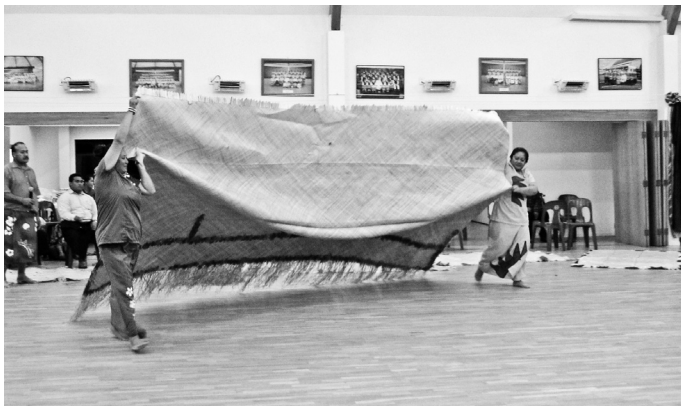
写真6 儀礼で贈られる大マット（イエ・テテレ）（オークランドにて）

イエ・サエの数少ない編み手たちの間では、これが神経を使うやっかいな仕事であることを認めつつも、生産物は誇りの持てるものであることと、高収入については評価が高い。スポンサーシップ・スキームの編み手の中には、村落部で定期的な現金へのアクセスが限られた地から、子どもを都市の学校に入れて大学まで出した人もいる。また、事務員になっても毎日職場に行って頭の疲れる仕事をするよりも、家にいて家族と過ごしながらいくらか稼げるなら、この方がずっと良い、と答えた高学歴の女性もいた。