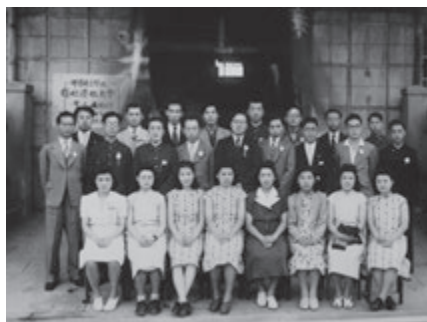
写真2 復校慶祝大会での教員の記念写真 (1946年6月6日撮影)