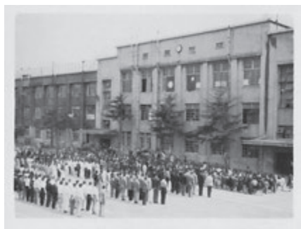
写真3 大開小学校での集会(1946年6月6日か9月15日ごろ撮影)