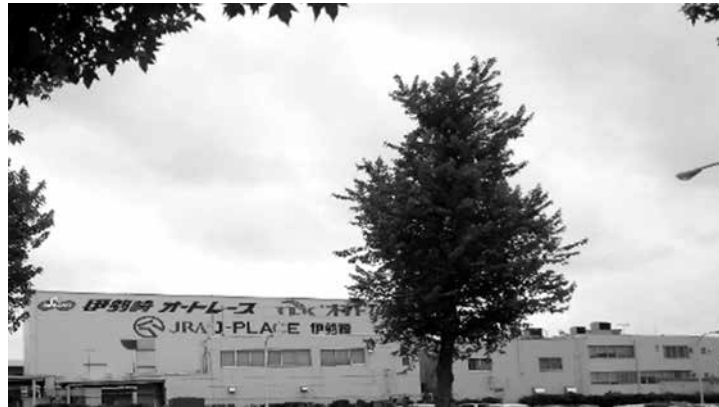
図表 3-1：公営競技の集積・複合化_伊勢崎オートレース場（群馬県）