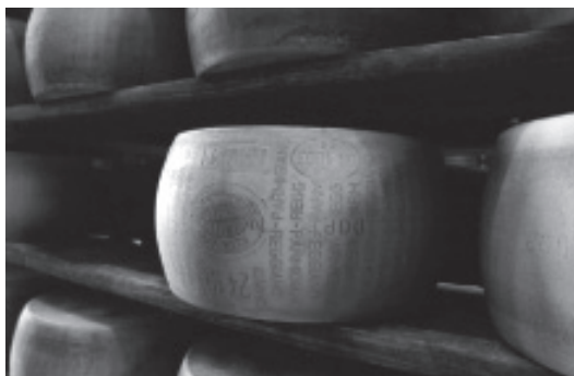
写真2 パルミジャーノ (Parmigiano Reggiano)