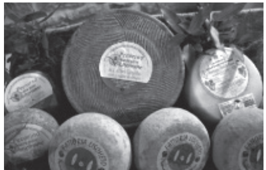
写真1 ヴォルテッラーネ(Pecorino delle Balze Volterrane)

チーズはトスカーナ州ピサ県のペコリーノ・デッレ・バルゼ・ヴォルテッラーネ(Pecorino delle Balze Volterrane)(以下「ヴォルテッラーネ」と記す)、およびエミリア=ロマーニャ州のパルミジャーノ・レッジャーノ(Parmigiano Reggiano)(以下「パルミジャーノ」と記す)を取り上げる。この2つを取り上げる理由は次のとおりである。前者は加盟国の要件適合審査前の手続きである公会議を2013年7月3日に開催したばかりのDOP申請中の製品である。上記の地理的表示保護製品の登録手続きの段階で言うと2013年8月現在第1段階を終え、第2段階に進む前に原産地で公会議を開催し申請書の最終調整を行ったところである。今後EUに出願し審査を受けDOPとして登録されるまでおよそ12ヶ月がかかると言われている。ピサ近隣出身者に聞いてもそのチーズの存在が知られていないとおりにまだ無名のチーズである。