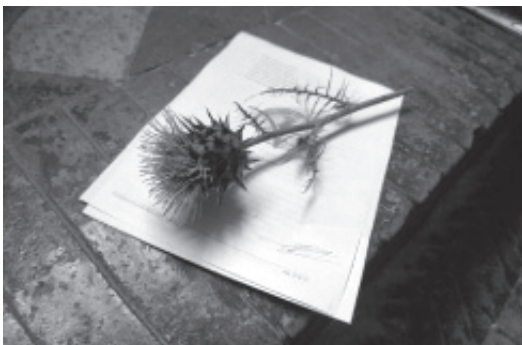
写真5 凝乳の酵素として用いるカルドン