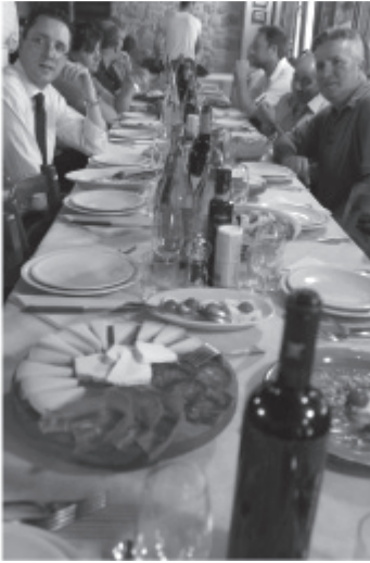
写真6 アンティパストとして供されたヴォルテッラーネ