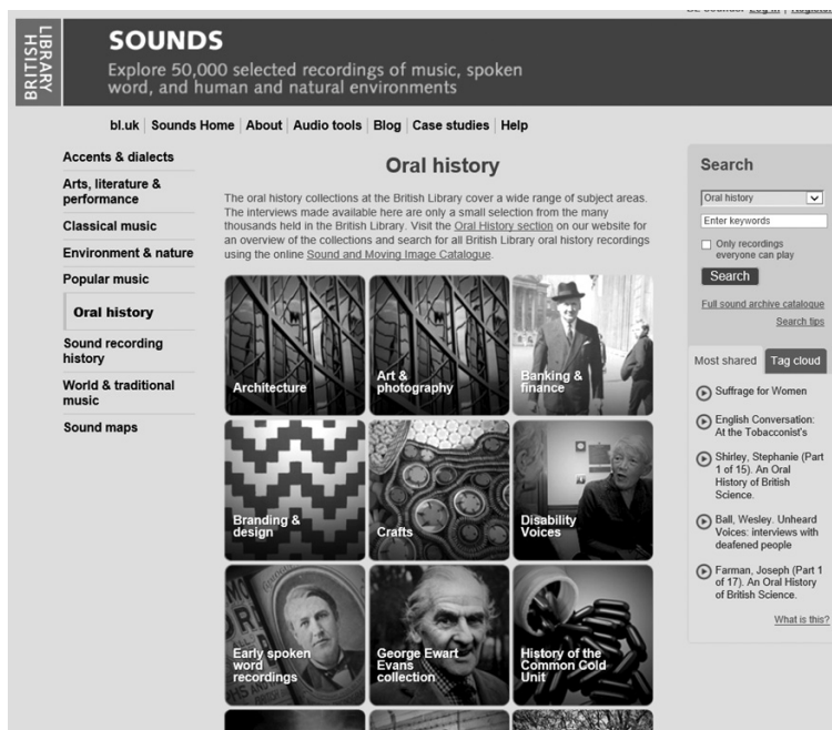
図4 Oral History の Web サイト

ある。図4を見ると、音声の資料の中にオーラルヒストリーが位置づけられ、外部から見やすい、聴きやすい、読みやすい形でまとめられていることがわかる。なお、大英図書館に保存されるオーラルヒストリーの多くは、テープ起こしに加えて family background, childhood, education, work, leisure and later life などの個人属性を記述している。