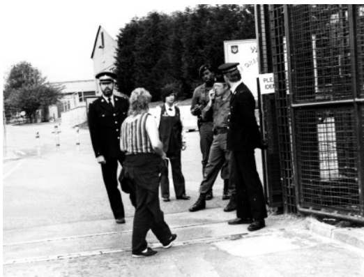
図5 Greenham in Common の写真

なお、大英図書館における数々の活動は、内部の優秀なスタッフだけでなく、数々の外部支援者によって支えられている。例えば、The National Life Stories Collection の運営に関しては、外部からの参加者も含めてディレクター3名、プロジェクト別のディレクター4名、会計1名、学術コンサルタント1名、カタログ作成者1