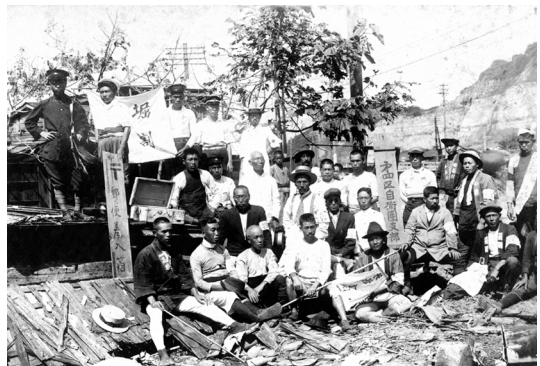
震災直後の自警団 注）「第4区の自衛団」の団旗が見える。

このように自警団は、警察の延長線上の組織であり、警察権力の指揮の下行動をとっていたのです。まさに国家責任を問うて当然です。しかし、多くの民衆が自警団に協力し虐殺に加担したことの責任はあります。民衆警察という組織を受け入れた事が、簡単に流言を信じてしまう意識構造につながってしまったのではないのでしょうか。