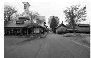
写真2 小布施堂界隈