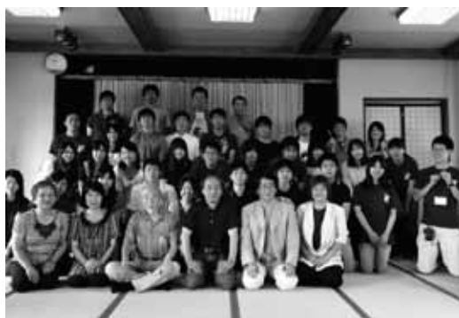
第1期合同調査チームのメンバー

この他、陸前高田の伝統的な祭りである動く七夕、けんか七夕への参加や、住民の皆さんとの交流など、学生にとって都会ではできない貴重な体験となっている。