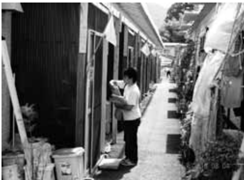
質問票を配布する（諏訪仮設住宅）