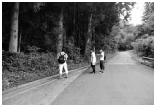
広田半島の自生樺の植生調査

この他、陸前高田の伝統的な祭りである動く七夕、けんか七夕への参加や、住民の皆さんとの交流など、学生にとって都会ではできない貴重な体験となっている。