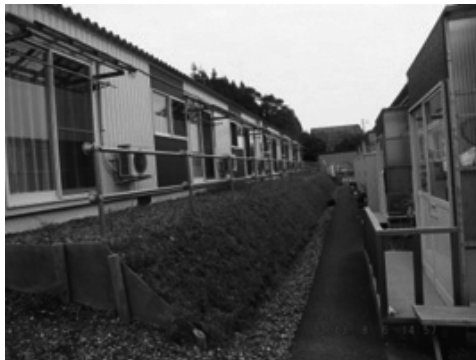
段差をつけた仮設住宅(賤当)

小友町の仮設住宅には小友・高田地区の被災者が多く居住している。「早く仮設から移転したい」と考える住民は多く、そのために「各家庭に応じた具体的な支援策が知りたい」、「大工さん(の賃金)や建築材料も値上がりしている」「小友の建築様式は他地区と異なるので心配だ」など不安を抱えている。中には「移転が決まって心に余裕が生まれた」ものの「自分の家族だけが行っていいのか」と複雑な思いを持つ住民もいる。