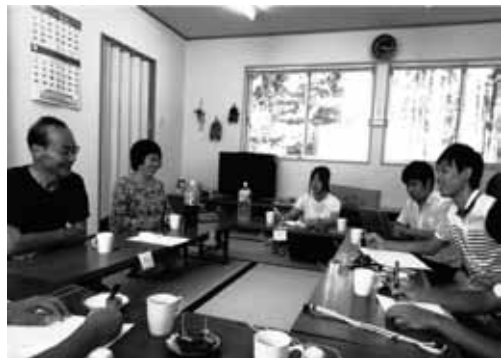
自治会長聞き取り（片地家仮設住宅）