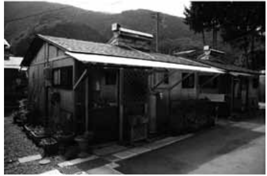
軒先を延ばした仮設住宅（火石）