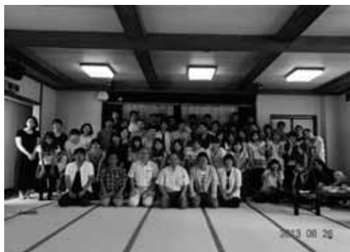
第2期合同調査チームのメンバー