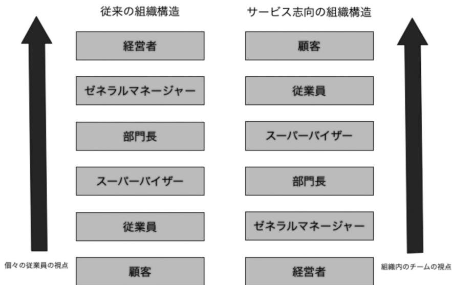
図3 インターナルマーケティングの成功企業にみられる逆の組織構造