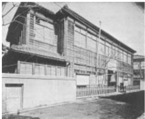
「現在の大阪愛染園」 （石井記念協会『石井十次伝』1934年、巻末による。）