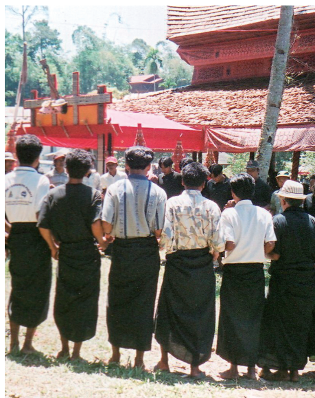
男性による葬送歌