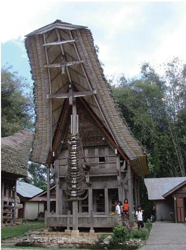
トンコナン正面（世界遺産候補地ケラ・ケス村）