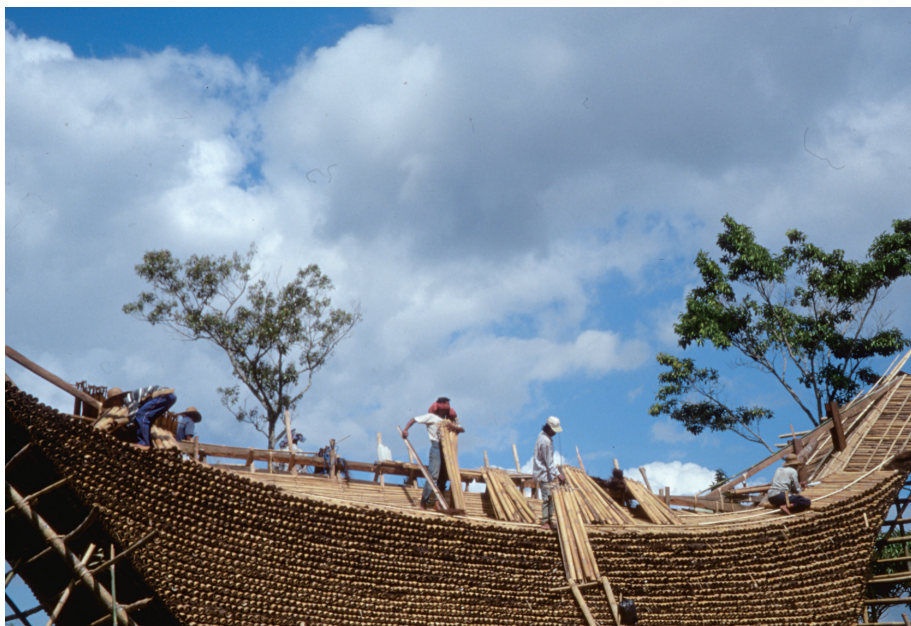
トンコナンの屋根修復