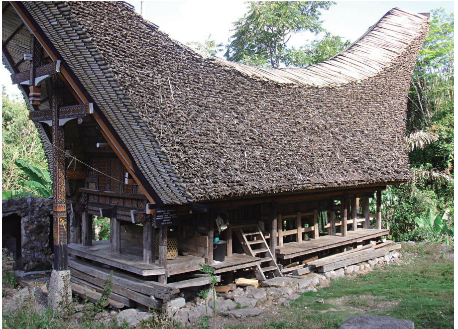
トラジャ人と一緒に修復したトンコナン。屋根の形に特徴がある（シラナン村）