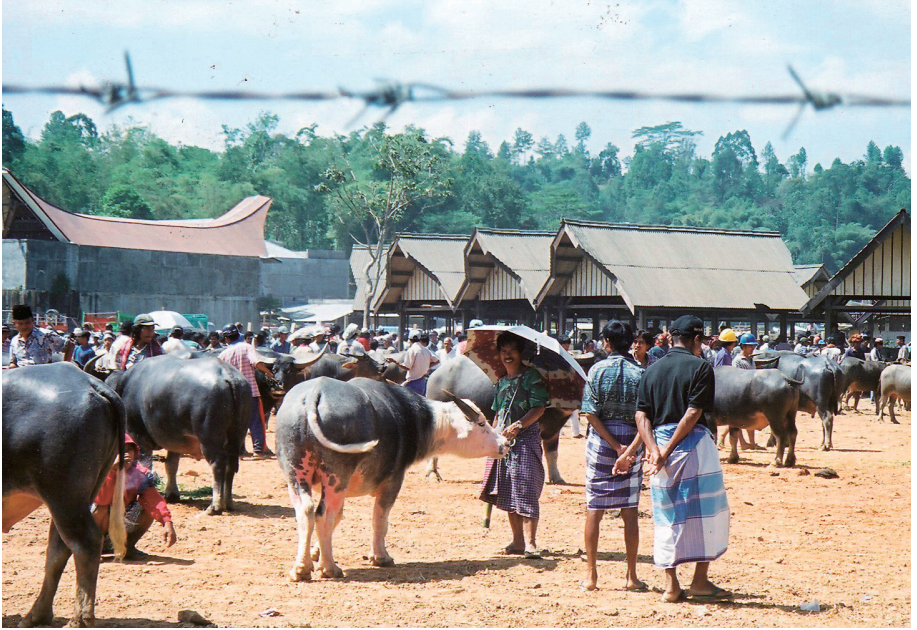
5日ごとに開かれる水牛市場（ランテパオ・ボリ）