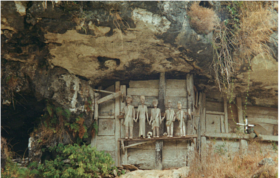
岸壁の墓、骨と死者の生前を忍ぶタウタウ人形