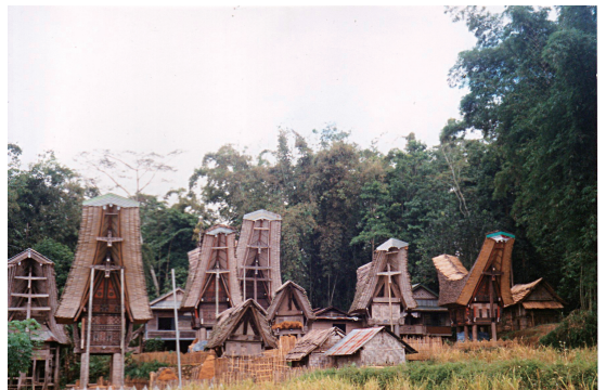
トンコナンのある村の風景（ラボ村）