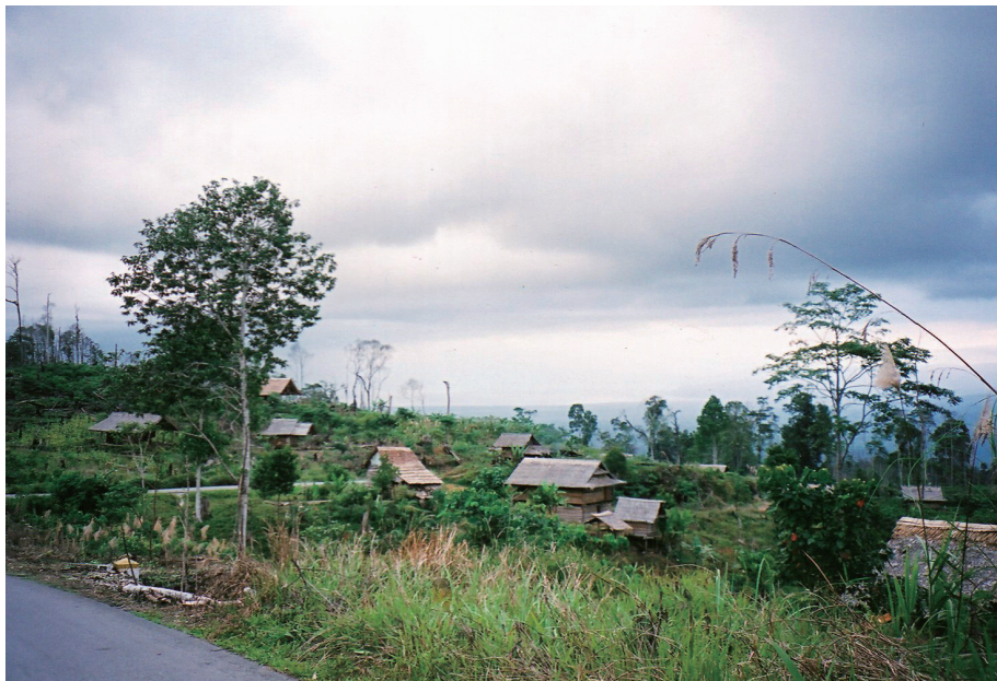
焼きうちから逃げのび、原野に建ち始めたトラジャ人移住者の家、中央スラウェシ