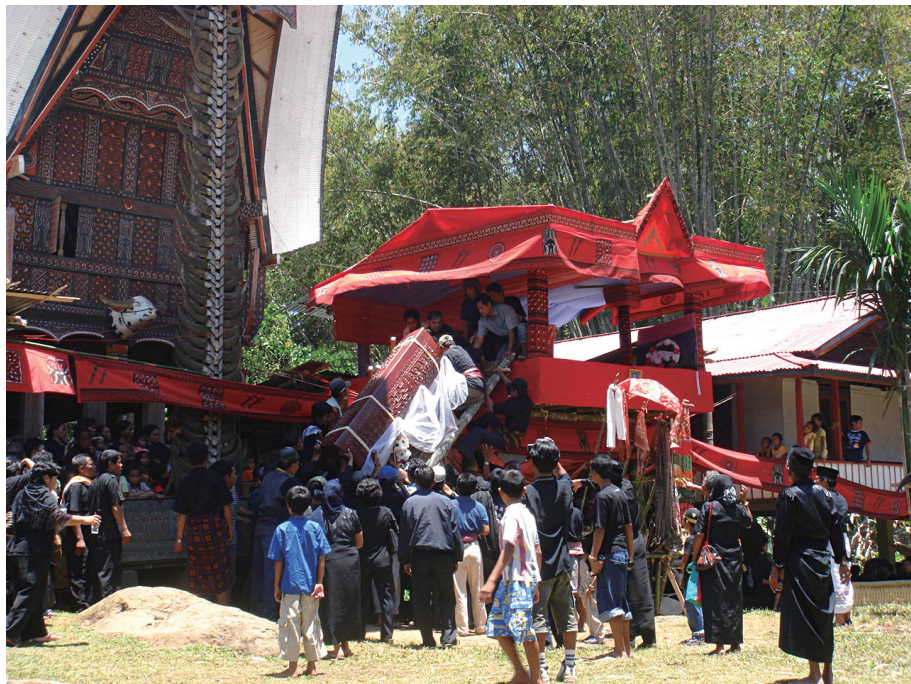
葬儀の風景，棺桶をアラン（米倉）から運び出しレラッキアン（安置する小屋）に移す