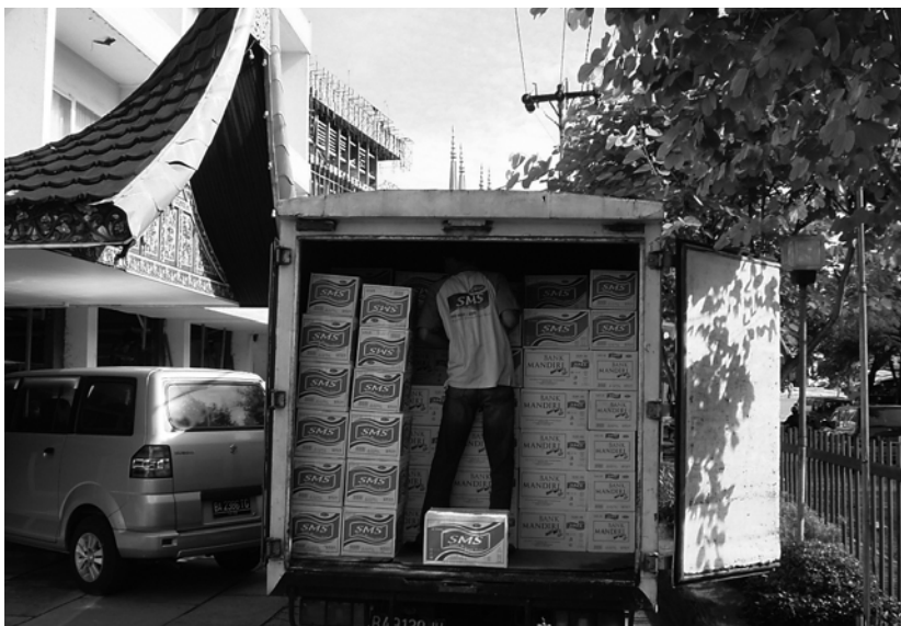
写真3 バダ市内のホテルに搬入される、ミネラルウォーターSMS。