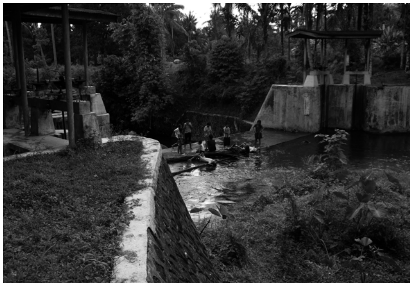
写真6 シチャウン灌漑水路。