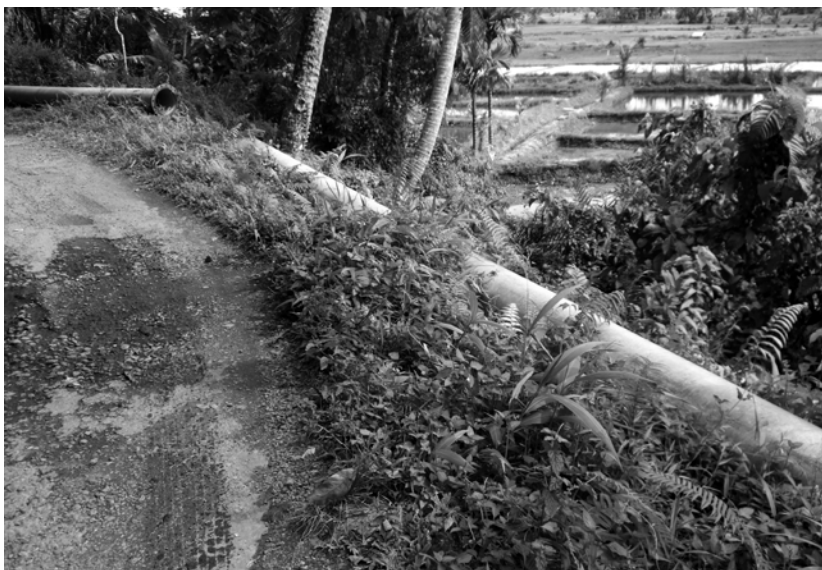
写真7 親県都に給水するために道路わきに置かれた給水管。直径40センチメートル。