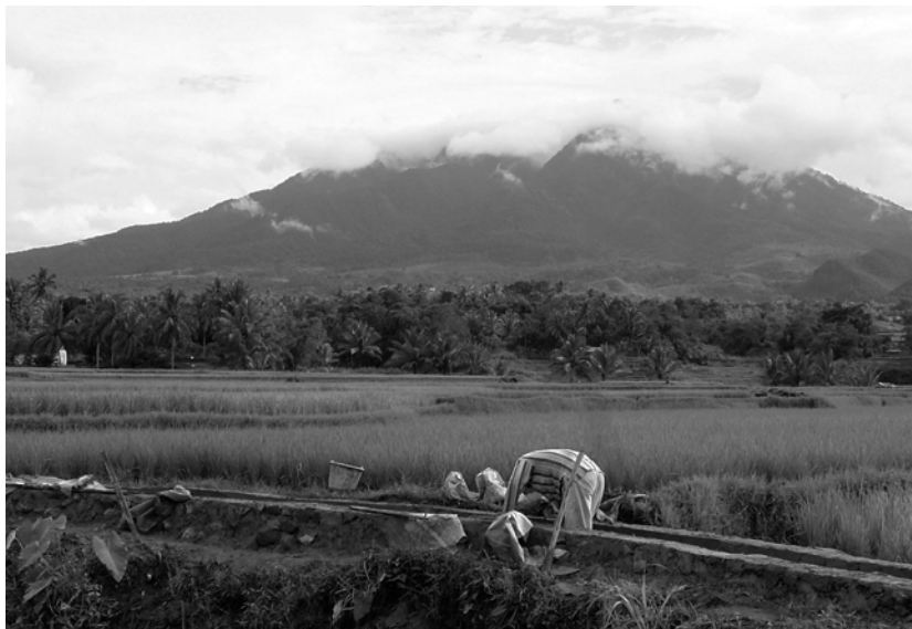
写真1 改修工事を受けているバタン・タビット灌漑用水。背後の山はサゴ山。