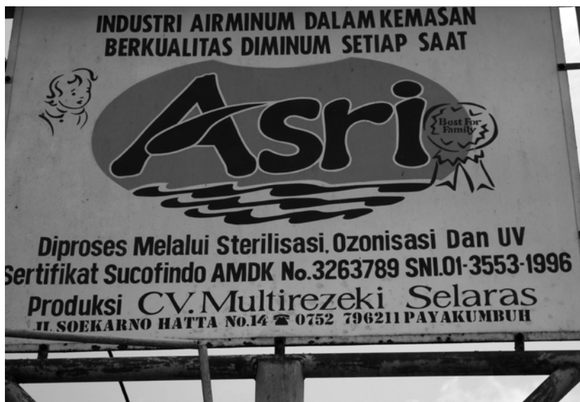
写真4 家内工業で作られるボトル飲料水「アスリ」。オゾンと紫外線による消毒済みと表記されている。