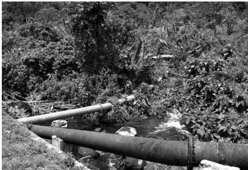
写真5 ルブック・ボンタの水源にあるバダン・バリアマン県水道公社の水道管。手前の管は古いもの。