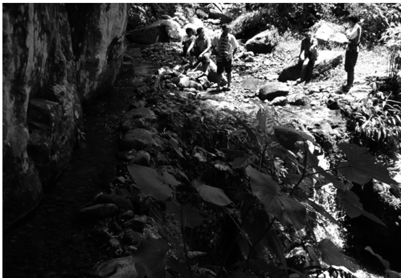
写真2 ピナゴ川に敷設されたムンゴ用の小規模ダム。左側の水路を通してムンゴの共有地に給水される。