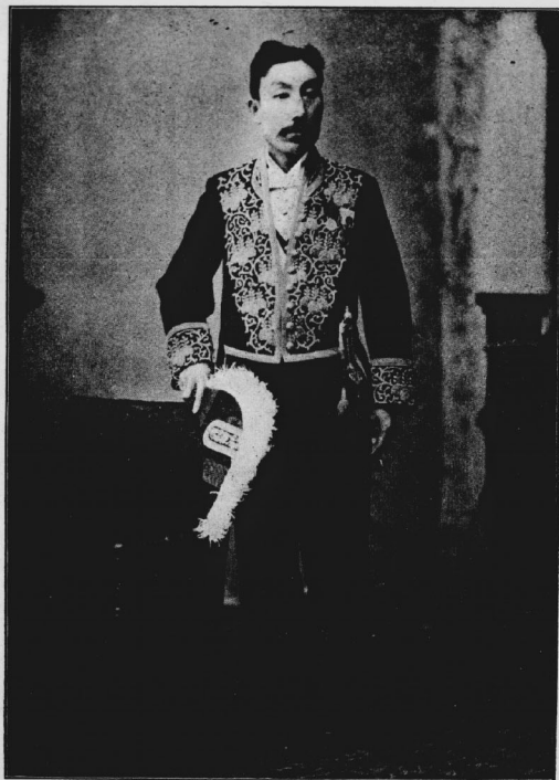
像育生先郎次謙梅 士博學法理總學大政法