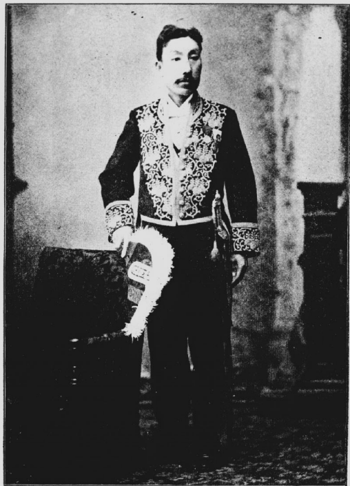
像育生先郎次謙梅 士博學法理總學大政法