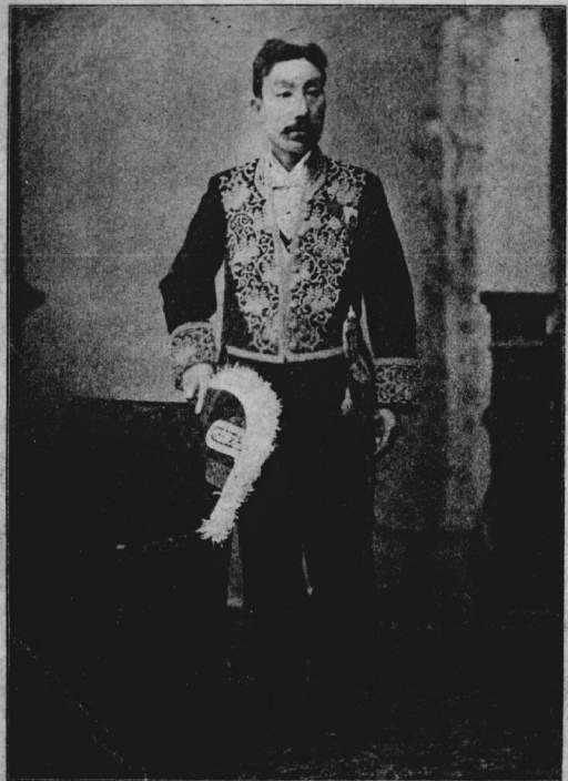
像育生先郎次謙梅 士博學法理總學大政法