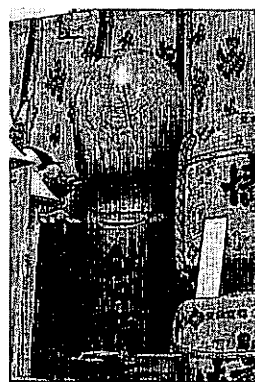
写真3 島根県八重垣神社 横の陽物(人工物)

子を修復する機構を持ったことがキッカケであろうと推測(文献14)されている。その後の生物進化の過程で、ヒトとチンパンジーが分かれたのは、遺伝子解析などの結果、遅くとも500万年前(文献15)のこととされている。