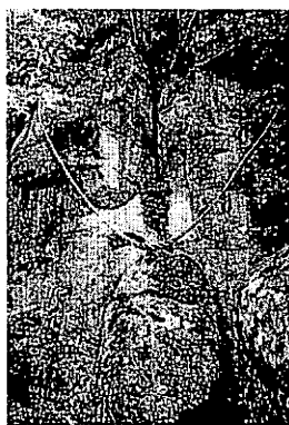
写真2 鹿児島県阿久根市 の陰石(自然物)