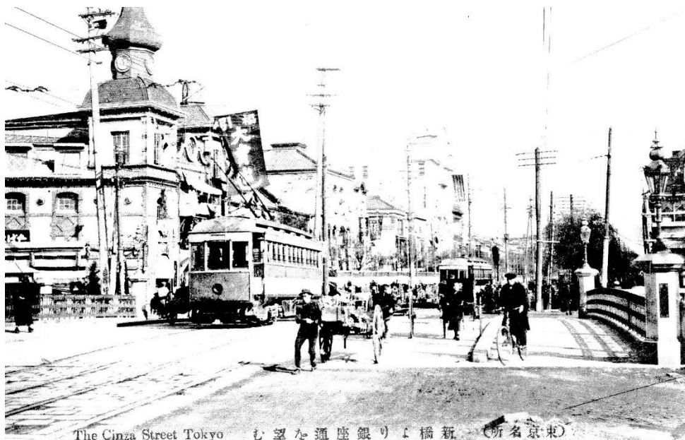
図表 4 新橋の帝国博品館

(注) 当時の絵葉書。左の建物が帝国博品館。大売出しののぼりが掲げられている。手前の橋が新橋。銀座通りを電化された路面電車が走っているの、大正初め頃と思われる。