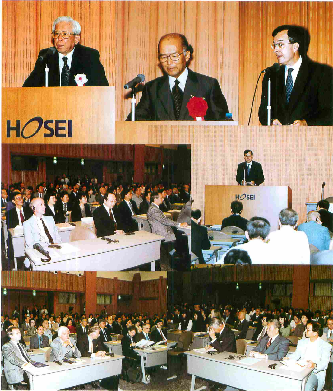
オープニングセレモニー