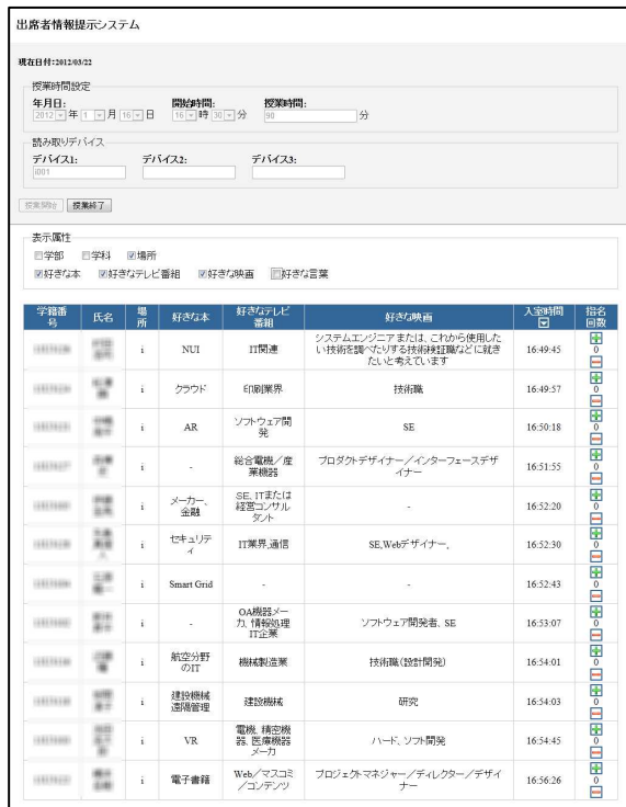
図 3 教員 PC における学生属性表示例

図 3 に 2012 年 1 月 16 日の授業での教員 PC における表示例を示す。画面上部から授業日時、授業時間、読み取りデバイスである専用リーダの ID、表示属性などの入力項目があり、これらを教員が設定する。その後「授